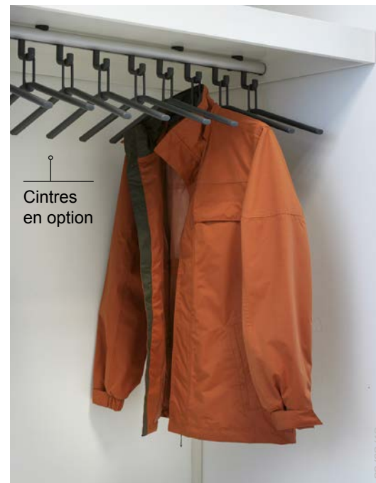
Cintres en option

PORTE-MANTEAUX EN LIGNE DE L20 À L200 CM !