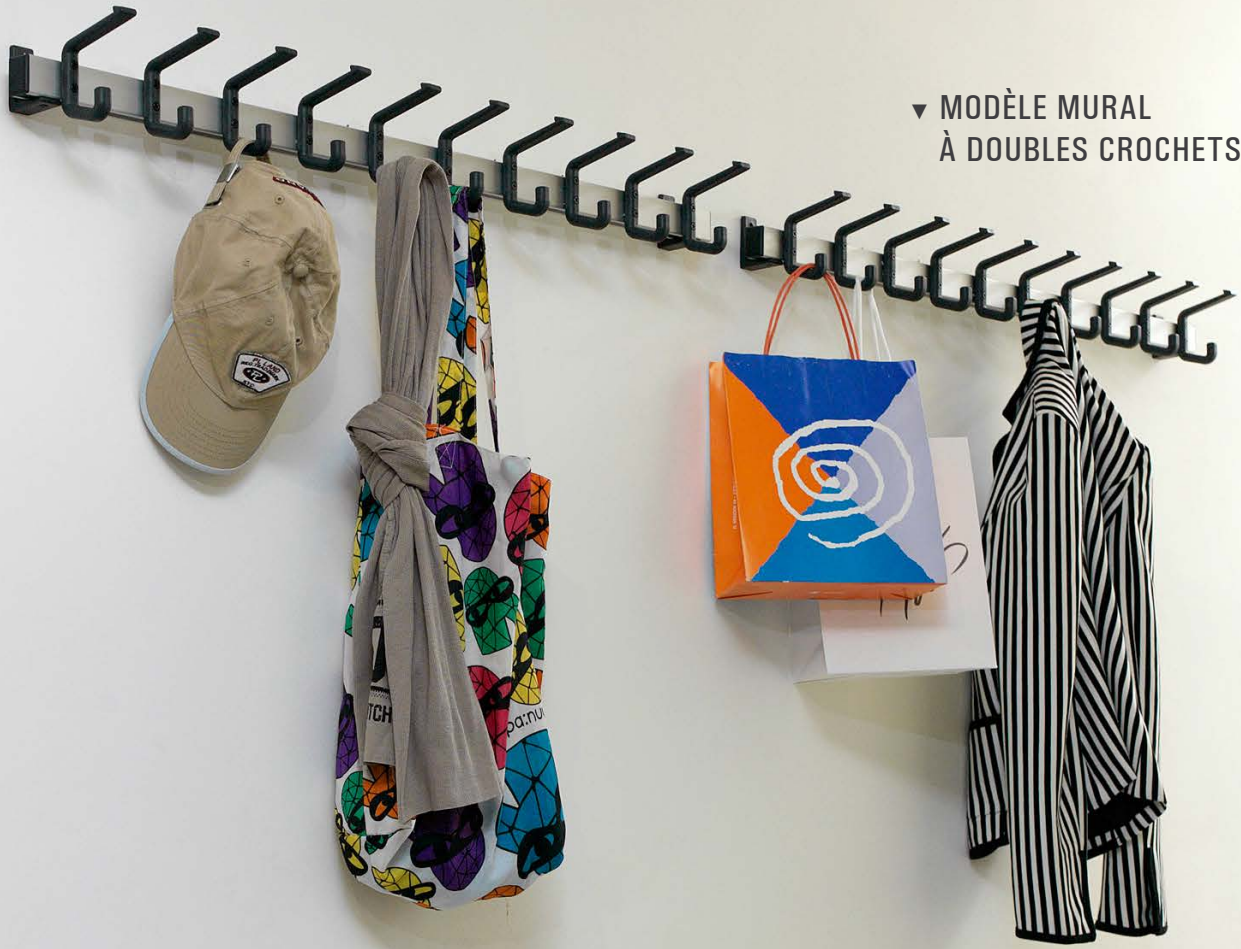
▼ MODÈLE MURAL À DOUBLES CROCHETS

PORTE-MANTEAUX EN LIGNE DE L20 À L200 CM !